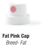
Fat Pink Cap Breed- Fat