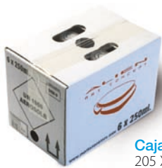
Caja (6 un.) 205 X 140 X 150 mm.